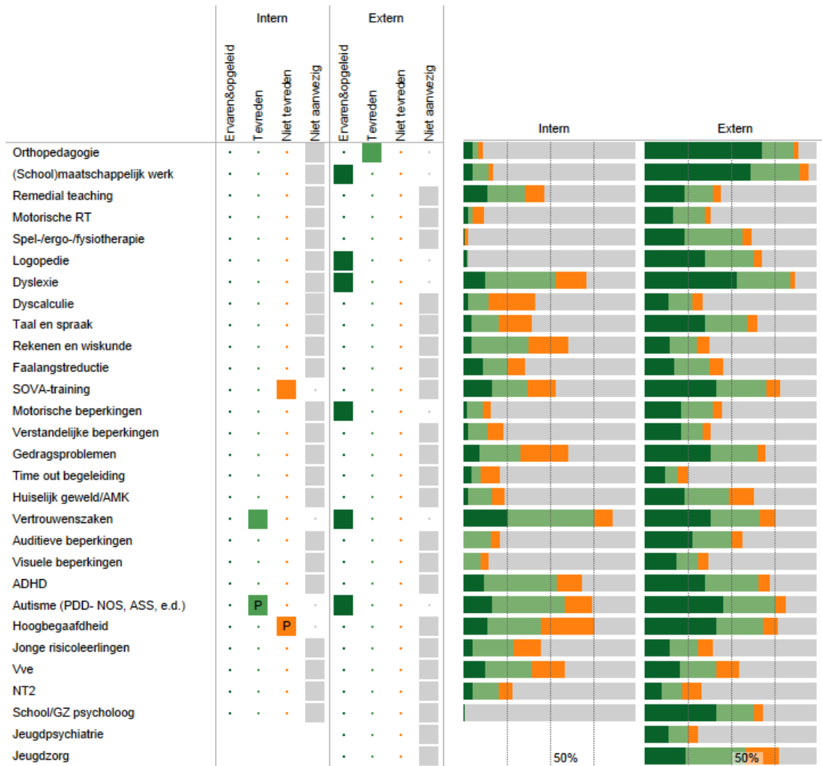
Gemiddelde alle scholen